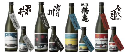
新潟清酒のふるまい 写真は新潟しゅぼつぼ