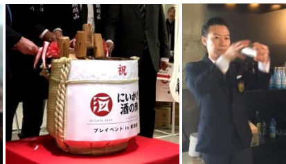
特設ステージイメージ（鏡開き、バーテン）