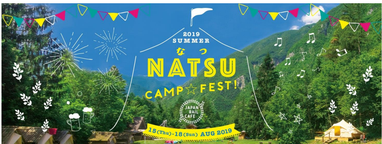
「NATSU CAMP FEST」 キービジュアル