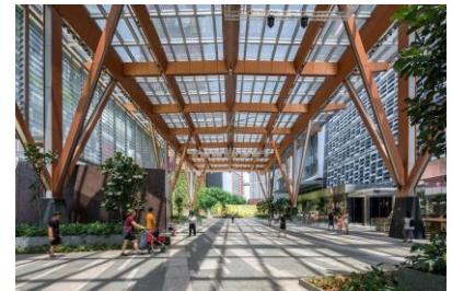
「JAPAN RAIL CAFE」店前広場