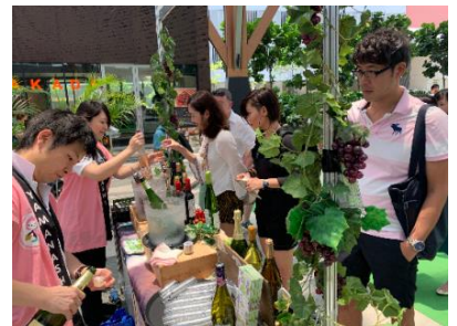
ブース出展イメージ（前回イベント時の様子）