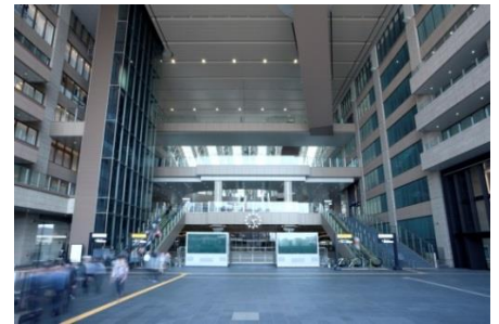
会場イメージ(アトリウム広場)