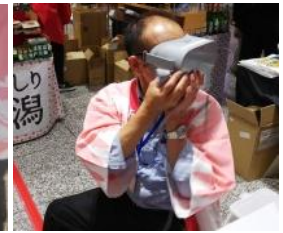
各種体験イベントの実施 (金塊つかみ体験、佐渡 VR 体験)