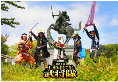
越後上越上杉おもてなし武将隊