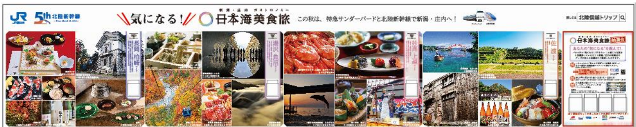
大型パネルイメージ