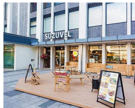
CoCoLo 西館 1F「SUZUVEL」

『みんなが、うれしい「食」のために。ここにしかない。ここにだけある「食」を考える。』をコンセプトに、長岡市内で4ショップ、新潟市内で2ショップの飲食店を運営。CoCoLo 西館 1F のテナント「SUZUVEL」の運営会社です。