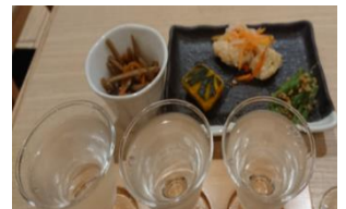
沿線おつまみセットイメージ