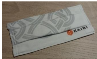
オリジナルマスク

「海里」ロゴをあしらったマスクです。地元新潟の企業である榊刷屋（すりや）がTシャツ生地を使用し、ハンドメイドで製作しており、着け心地も抜群です。