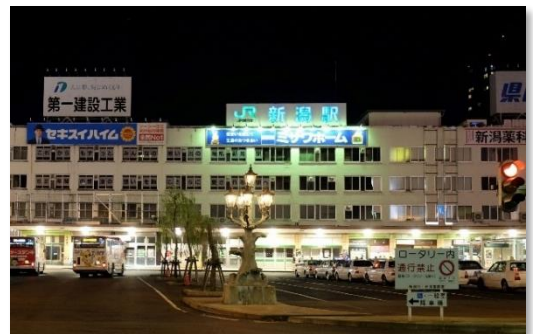
新潟駅「駅名標」（万代口駅舎）