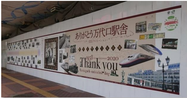
新潟駅思い出写真展（縦2m×横17m）