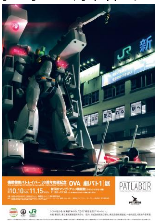
「機動警察パトレイバー」企画展タイアップポスター (JR 東日本新潟支社エリアの駅にて掲出)