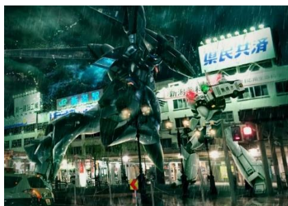
「機動警察パトレイバー」新潟駅先行販売グッズ ビジュアルイメージ (今回用に新規描き下ろし)