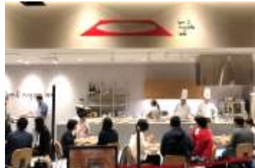
ライブキッチン風景