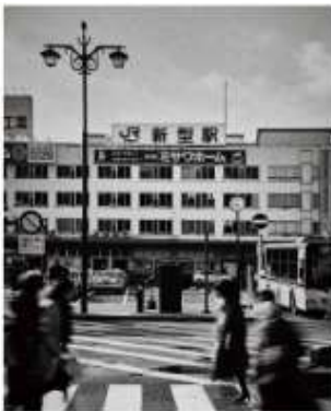
新潟を、新型へ。 Niigata to the Next

JR 東日本新潟支社が進める新潟駅を起点に、地域やシヨク（食・職）文化の担い手と連携し、駅からはじまるまちづくりにつなげるプロジェクトです。プロジェクト名の“N”は、NIIGATAの頭文字であり、新しい新潟を起点に新たな価値を創り (NEW)、次なる時代へ (NEXT) という思いが込められています。2018年4月15日新潟駅 N プロジェクト第一弾となる食文化発信拠点施設「CoCoLo 西 N+」がオープンしました。