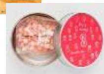
コラボメニュー（イメージ）