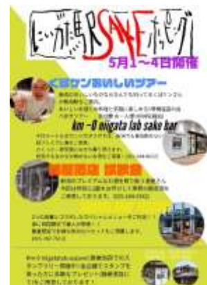
SAKE ホッピング（イメージ）

開催日 2019年5月1日（水）～5月4日（土） ①11:00～ ②15:00～（どちらも1時間程度を予定） 集合場所 JR新潟駅 CoCoLo 西N+内「km-0 niigata lab」（新潟駅西口改札すぐ） 内容 「km-0 niigata lab」でお茶を飲みながらガイダンスをし、「SUZUVEL」でお酒1杯とおつまみ、新潟駅万代口にある「錦屋酒店」でお猪口2～3杯程度のお酒を楽しみます。 3ショップ全部をまわった方には粗品をプレゼント！ 参加費 1,000円（税別） 定員 各回10名まで（事前予約優先） 協力 CoCoLo 西館 SUZUVEL / 錦屋酒店※4 問い合わせ km-0 niigata lab（キロメートルゼロ ニイガタ ラボ） TEL：025-384-8812 その他 期間中、km-0 niigata lab、SUZUVEL では手軽なお酒とおつまみセットも提供予定。（SAKE ホッピングとは別途料金）