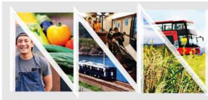
地元シェフ×地域食材 列車×日本酒・音楽 ファーム×レストラン