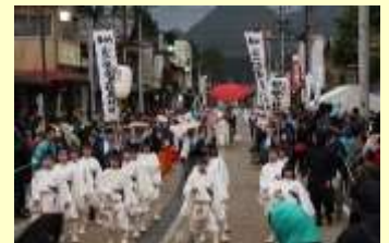
つがわ狐の嫁入り行列

津川駅では Suica をご利用いただけません。指定席券のほか乗車券をお買い求めの上、ご乗車ください。