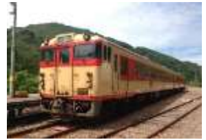
一般気動車(国鉄急行色) ※車両は変更になる場合があります