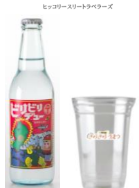
庄内サイダー (ビリビリデュー)