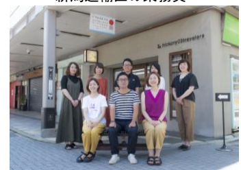
ヒッコリースリートラベラーズ

新潟市の商店街「上古町商店街」に店舗を構え、地元新潟にゆかりのある商品のセレクトや商品開発を行っているクリエイティブ集団。その地域だからこそできるモノや人との商品開発、デザイン、商店街イベントなど幅広くやわらかく活動しています。2015年グッドデザイン賞受賞（地域に根差したデザイン活動）。