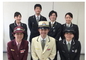
新潟運輸区の乗務員

～hickory03travelers（ヒッコリースリートラベラーズ）のご紹介～