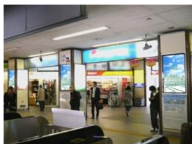
新潟駅万代ロ J・ADビジョン