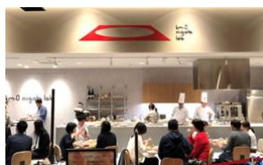
km-0 niigata lab