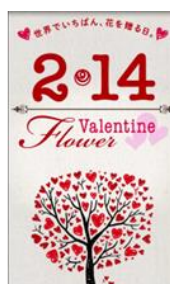
にいがたフラワーバレンタインPR動画