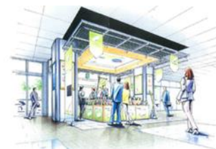
新潟駅万代ロイベントスペース (イメージ)

花の撮影スポットでは、環境保全、維持活動のオピニアンリーダーとして活動する「ミス・アース・ジャパン新潟ファイナリスト」が花のPRを行います。