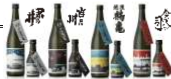
日本酒「新潟しゅぽっぽ」