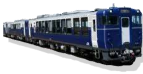
宵乃 Shu*Kura 車両イメージ