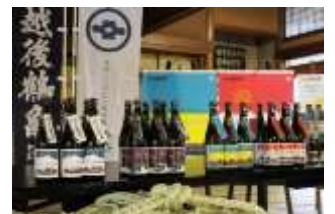
昨年度の発表会の様子