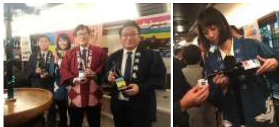
「宵乃 Shu*Kura」でのふるまいイベント昨年の様子

※当日の天候や運行状況により、イベント内容の変更または中止となる場合があります。予めご了承ください。