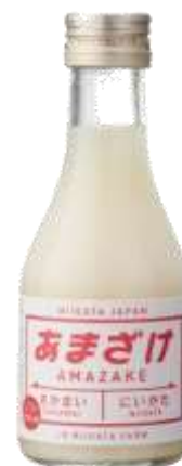
「新潟しゅぽっぼ あまざけ」イメージ