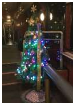
4号車展望車のクリスマスツリー