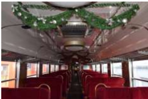
車内のクリスマス装飾