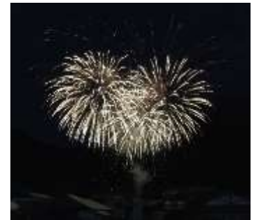
昨年の日出谷駅での花火