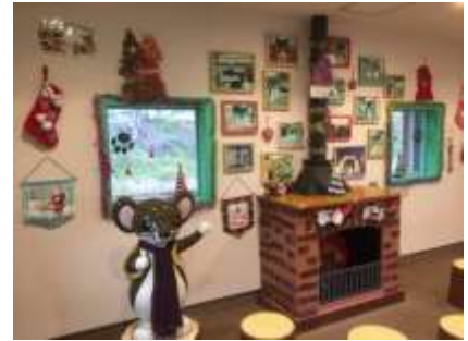
「オコジロウの家」のクリスマス装飾