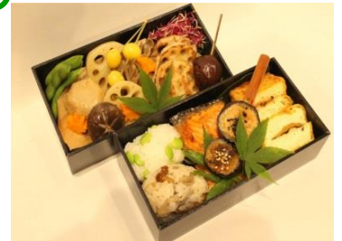
美食旅おつまみ(イメージ)