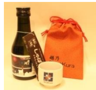
吉乃川の新潟しゅぽっぽ