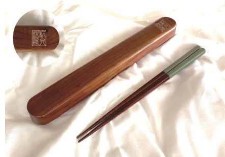
駅弁味の陣オリジナル箸 (長野県産ヒノキ使用) + 木製ケース