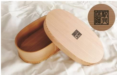
駅弁味の陣オリジナル秋田県産曲げわっぱ

*JRE MALL は、鉄道グッズや Suica のペンギングッズはもちろん、日用品のお買い物もできるショッピングサイトです。