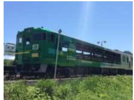
びゅうコースター風っこ