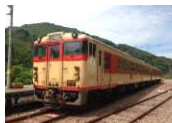
国鉄急行色気動車