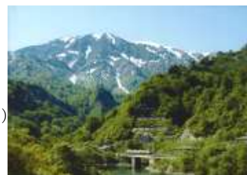
新緑の頃の只見町