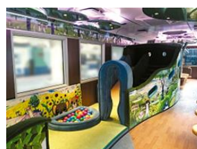
オコジロウ展望車両