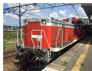
DL(ディーゼル機関車)「DE10」

※新潟駅からは快速「DLリレー号」の他に 新潟駅9:19 発 新津駅9:39 着 の普通列車もあります。