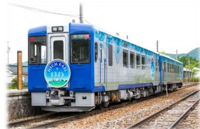
〈HIGH RAIL 1375〉