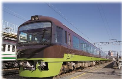
〈リゾートやまどり〉