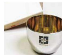
コースの一例 (越乃Shu*Kuraオリジナルお猪口)