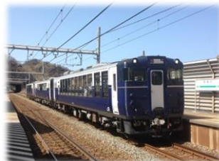
〈越乃Shu * Kura〉