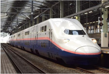
E4系 (Max とき)

普段新潟では見ることができないE6系・E7系、そして新潟ではおなじみのMax2階建てE4系車両を展示します。