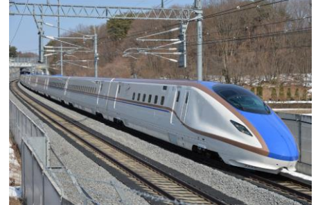
E7系 (かがやき・はくたか等)