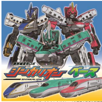
新幹線変形ロボ シンカリオン

「新幹線変形ロボ シンカリオン」が新潟新幹線車両センターにやってきます。各ゲームに参加してオリジナルグッズを手に入れたり、一緒に記念撮影もお楽しみいただけます。