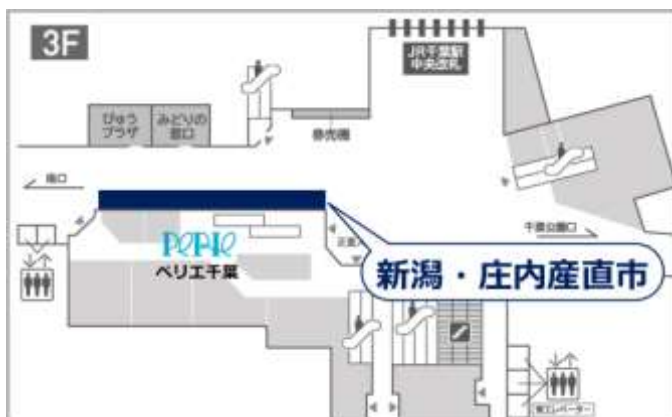
産直市会場位置図