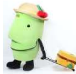
庄内エリア(山形県) きてけろくん