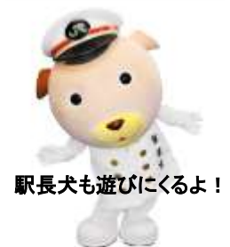
駅長犬も遊びにくるよ！

当日は新潟県・山形県庄内エリアの各自治体のご当地キャラクターのみならずJR東日本千葉支社のキャラクター「駅長犬」も参加します！