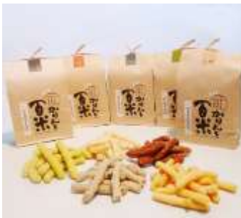
庄内銘菓 かりんとう