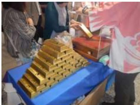
自治体による体験コーナーの様子(佐渡の金塊つかみ、デコイ絵付け体験)