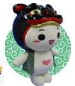
庄内エリア(山形県酒田市) もしえのん