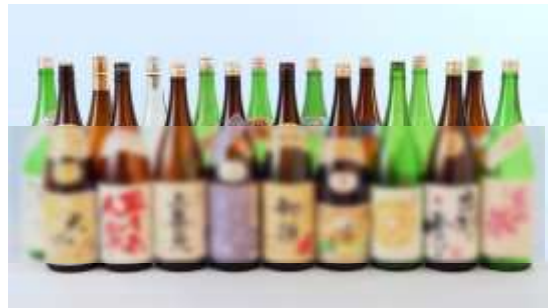
庄内地酒(新潟清酒も多く取りそろえます！)