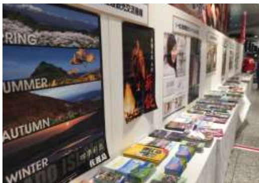
観光PRブースイメージ