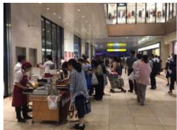
千葉駅での過去の産直市の様子(ちばのいち)