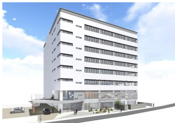
新潟支社ビル イメージ