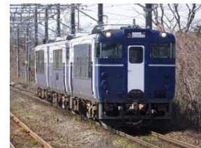
信州 Shu*Kura 車両