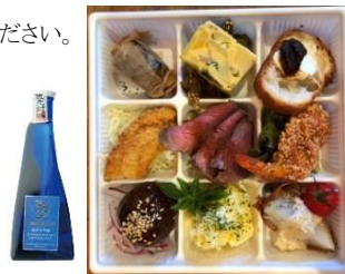
信州 Shu*Kura おつまみセット (1号車)