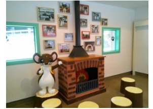
津川駅・オコジロウの家