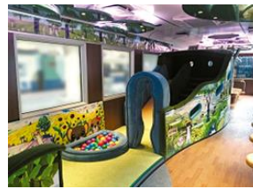
オコジヨ展望車両

※新潟駅からは快速「DLリレー号」の他に 新潟駅9:19 発 新津駅9:39 着 の普通列車もあります。