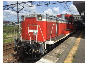
DL（ディーゼル機関車）「DE10」