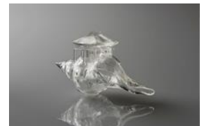
© AKI INOMATA / MAHO KUBOTA GALLERY

16号車(映像作品) アキ イノマタ AKI INOMATA 氏 ※上記作品は7月28日(土)より展示予定