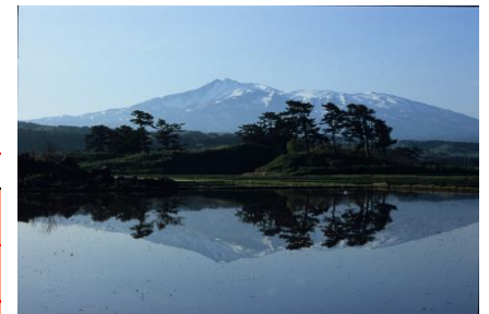
〈にかほ市〉九十九島と水田に映る鏡鳥海