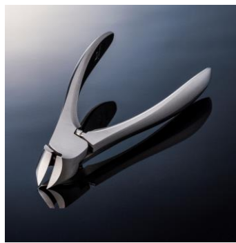
■工芸品部門金賞 「SUWADA つめ切り CLASSIC」

たっぷりのこだわりバターでさっくり焼き上げました。生地に練り込んだメープルシロップがふわりと香れば幸せ気分。焼き菓子の「シュクレイ」が自信を持ってお届けする逸品！