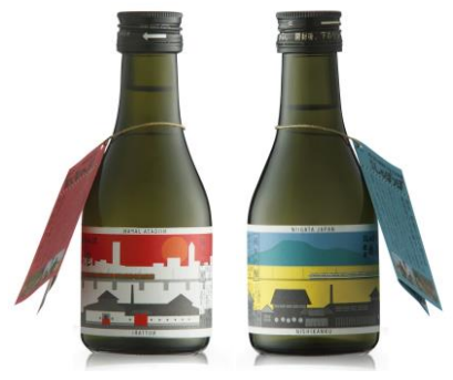
■地酒部門銀賞 「新潟しゅぼっぽ」

「切る」機能を研ぎ澄ますために熟練職人が一点一点丁寧に手仕上げにする SUWADA つめ切り。機能本位の美しいフォルム、カーブした刃で爪の形に合わせ処理できる。鍛冶屋のプライドが詰まった逸品。