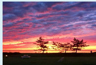
ホテルからの夕焼け

お問合せ、ご予約はWEB・またはお電話で「ホテルファミリーオ佐渡相川」 佐渡市小川 1267-1 URL: http://www.familio-sadoaikawa.com/ TEL: 0259-75-1020