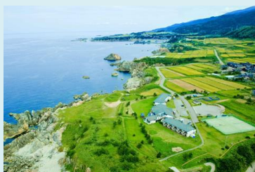
国定公園内に建つホテルファミリーオ佐渡相川

島旅におすすめの全室洋室オーシャンビューのホテル。「サドメシラン」認定のレストランで、佐渡産食材にこだわった滋味あふれるお食事をお召し上がりください。