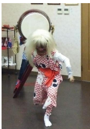
鬼太鼓演舞の様子

「蒸しかまど」は独自の構造と素焼き陶器の特性である、熱効率の高さから、お米のうまみを最大限に引き出すと言われております。