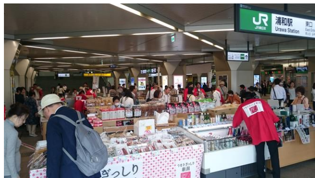
前回の浦和駅での新潟産直市の様子