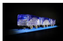
江戸切り子のプラレール