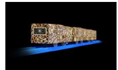
箱根寄木細工のプラレール

※新幹線ホームへのご入場は入場券や新幹線のきっぷが必要となります ※イベントの内容などは変更になる場合があります。※画像は全てイメージです。