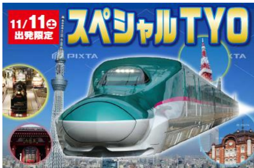
旅行商品パンフレットイメージ