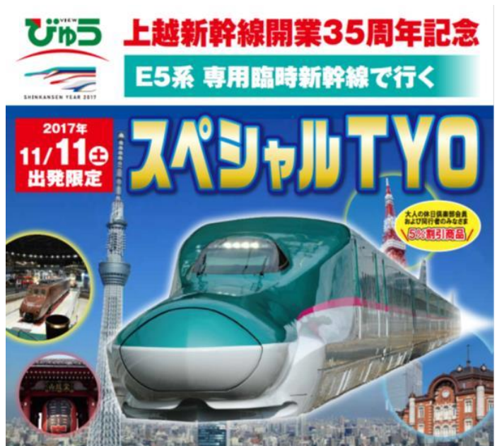
旅行商品パンフレットイメージ