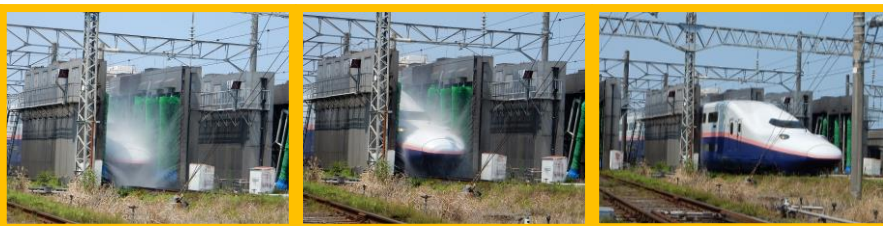
新幹線が洗淨線を通過するイメージ

新幹線がどのように洗淨されているかご存知ですか？今回は新幹線に乗りながら、珍しい洗淨体験をすることができます。ぜひお楽しみください！