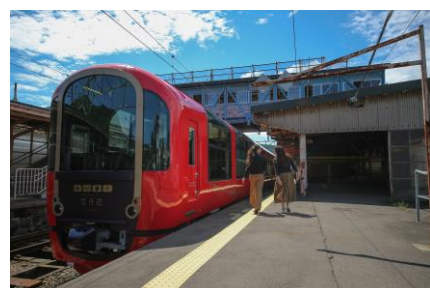
えちごトキめきリゾート雪月花