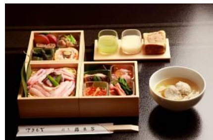
「鶴来家」による三段重