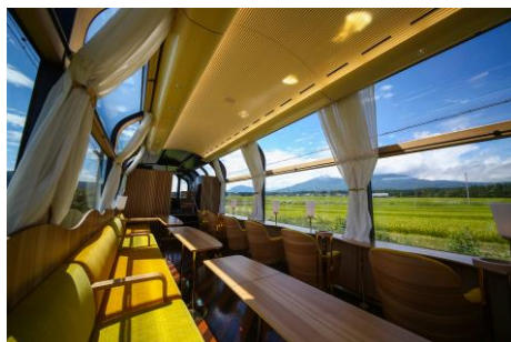
ダイナミックな車窓が印象的な車内