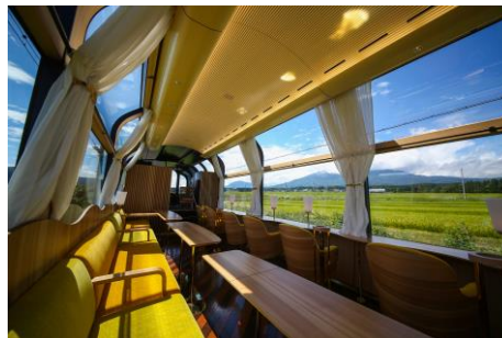
ダイナミックな車窓が印象的な車内