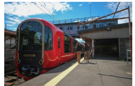
えちごトキめきリゾート雪月花