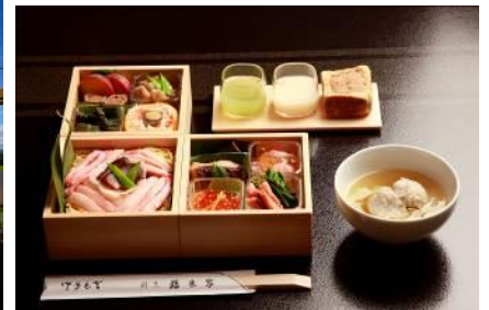
「鶴来家」による三段重