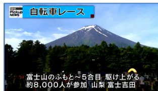
ニュース、気象予報