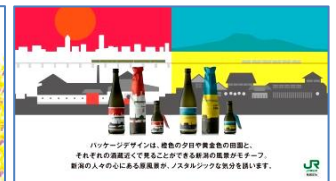
弊社コマーシャル