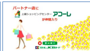
企業コマーシャル(広告)