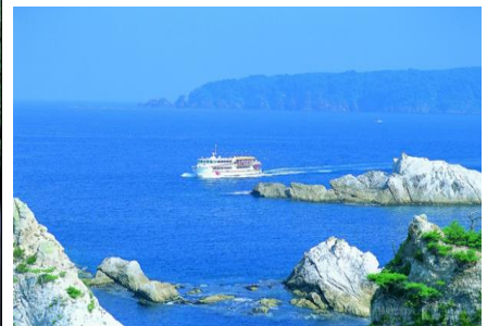
浄土ヶ浜・観光船