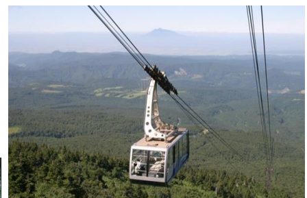
八甲田ロープウェー