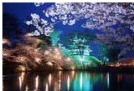
【高田公園の夜桜】(イメージ)