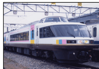
【妙高ミズバショウ号】 写真はイメージ