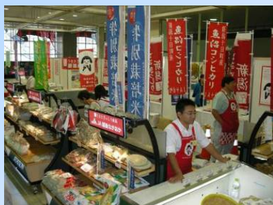
特産品販売コーナー