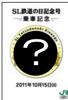
【乗車記念カード・図柄は当日のお楽しみ】