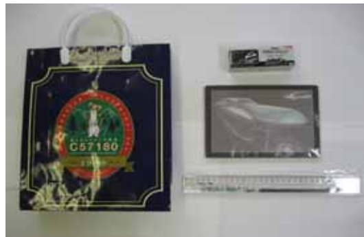
【お楽しみプレゼント(イメージ)】