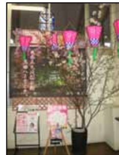
桜コーナー (昨年の様子)