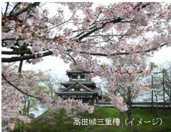
高田城三重櫓(イメージ)