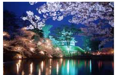
ライトアップ(イメージ)

4月9日(金)・10日(土)11日(日)人力車運行(高田公園内を人力車が運行します。)