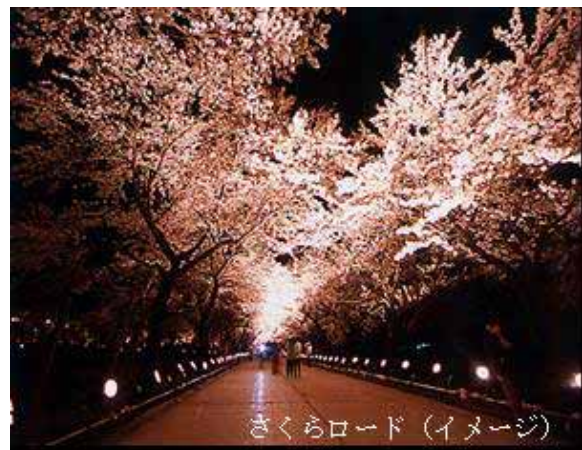
さくらロード(イメージ)