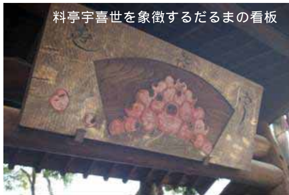
料亭宇喜世を象徴するだるまの看板