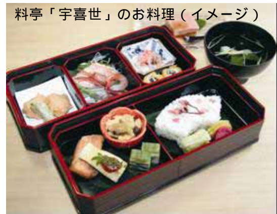
料亭「宇喜世」のお料理(イメージ)