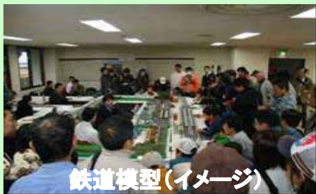
鉄道模型(イメージ)