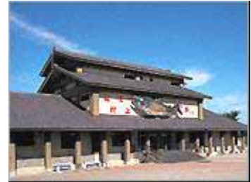
【イヨボヤ会館(イメージ)】

設定日 : 3月20日(金・祝) 募集人員 : 300名 受付時間 : 9:00 ~ 11:30 歩行距離 : 約5km 歩行時間 : 約1時間30分 ~ 3時間30分 参加費 : 無料 おもてなし : 村上茶のティーバックプレゼント 富士美園でのお茶サービス