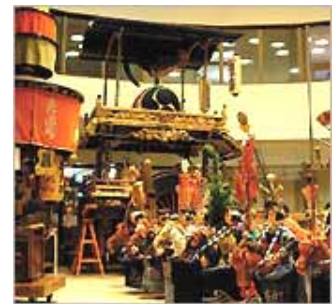
【おしゃぎり会館(イメージ)】